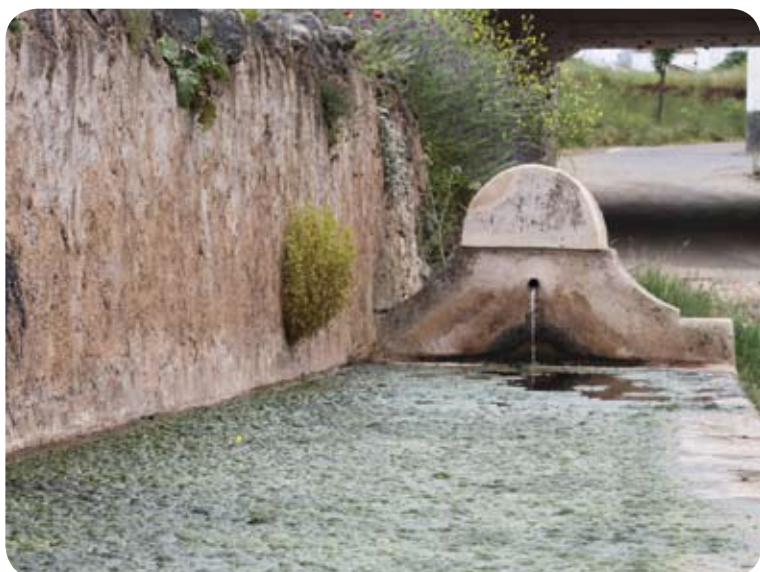
Abrevadero al inicio de la etapa