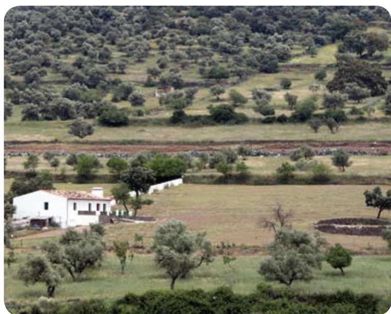
Las parcelas agroganaderas dibujan mosaicos en el paisaje

El camino describe un zig-zag en su bajada hasta que comienza a ensancharse entre parcelas delimitadas por muretes de piedra. La panorámica ofrece el valle del Riofrío atravesado por el ferrocarril Huelva-Zafra que cruzamos en un paso a nivel. En la parte más baja vadeamos donde confluyen dos arroyos y enlazamos con un camino terrizo que tomamos a la izquierda en dirección a la carretera.