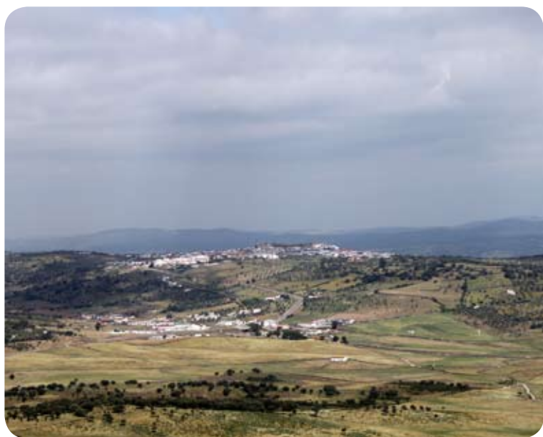
Panorámica de Cumbres Mayores desde la sierra del Viento

dente entre jarales que continúa unos metros apartado pero paralelo a la carretera.