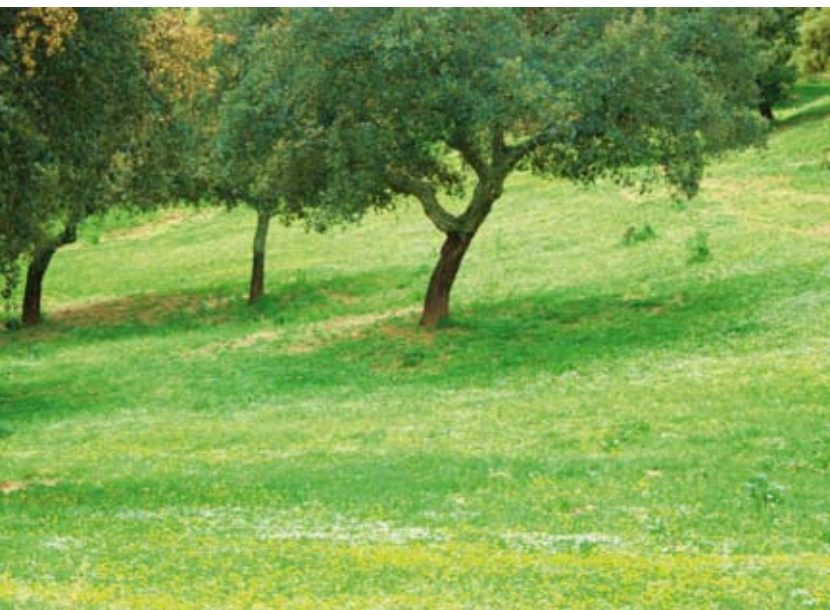
La dehesa muestra su colorido en meses primaverales

La cobertura arbórea va ganando protagonismo mientras transitamos por este camino rural junto a una antigua casa en estado ruinoso, en la que falta la cubierta pero aún mantiene los muros de mampuesto de piedra. La humedad gana en grado y al pasar un pequeño pinar, los quejigos se van a ir haciendo presentes en el descenso.