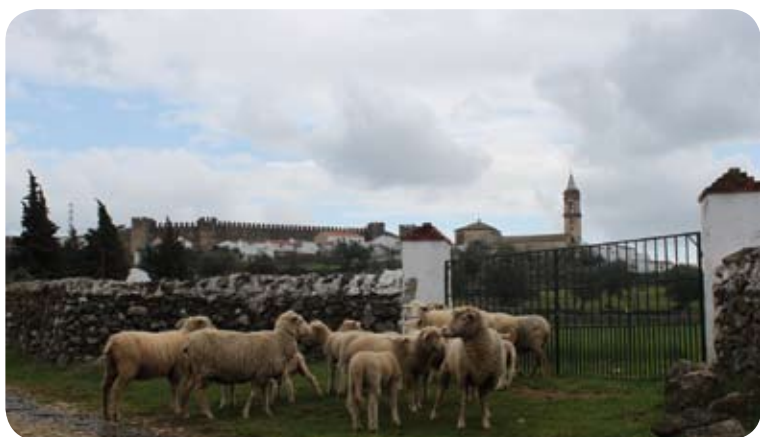
Inmediaciones a Cumbres Mayores