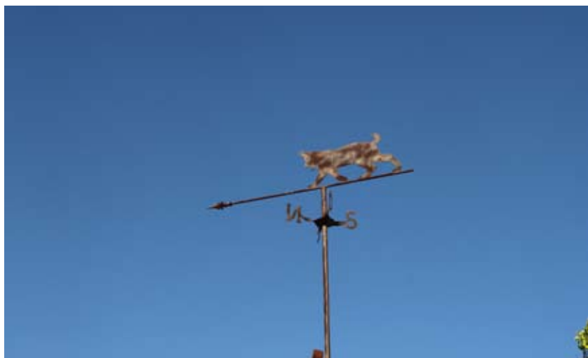
Veleta con silueta de lince en Cumbres de En medio

acero. Quizás un recuerdo remoto de cuando este escaso animal pobló estas sierras.