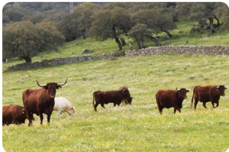
La ganadería es una constante en estas dehesas

El camino se vuelve algo impracticable cuando vadeamos el barranco de la Magdalena y una ligera pendiente. En este momento se abre ante nosotros una zona despoblada de encinas donde abundan los pastos y la trayectoria del itinerario vira bruscamente hacia la derecha remontando parte del barranco en una ladera de umbría donde la vegetación se va a ir haciendo mas abundante.