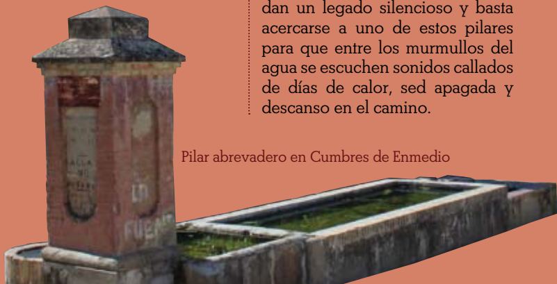
Pilar abrevadero en Cumbres de Enmedio

Pozos, fuentes y abrevaderos guardan un legado silencioso y basta acercarse a uno de estos pilares para que entre los murmullos del agua se escuchen sonidos callados de días de calor, sed apagada y descanso en el camino.