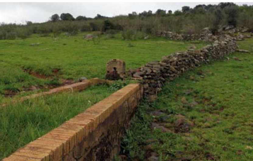
Fuente con pilar en el barranco de las Cañadas

gular de unos 12 metros de longitud y realizado en ladrillo macizo. En el lado opuesto se encuentra el frontón por donde sale el caño de agua que vierte a una pileta comunicada a su vez con el pilar por rebaje del pretil.