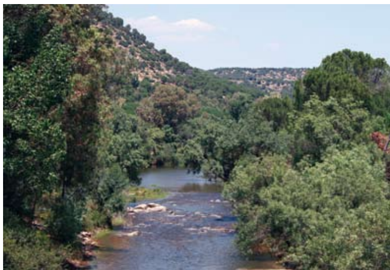
Valle del río Jándula

Los cauces fluviales se encajan entre la roca de granito que domina el sustrato y van a ir dibujando angostos valles en los que abundan los derribos y berrocales a veces tan llamativos como espectaculares. Es el reino del granito y de la jara, último bastión de supervivencia del lince ibérico.