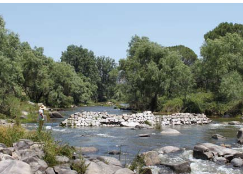
Cauce del río Jándula

Volveremos a cruzar otra cancela de paso y en la parte mas baja coincidiremos con la pista que conduce a la Central Eléctrica y el embalse de Encinarejo. En este punto nuestra dirección vira a la derecha por el camino pero existe la opción de visitar el embalse, espacio que en época estival convierte sus orillas en playas de interior.