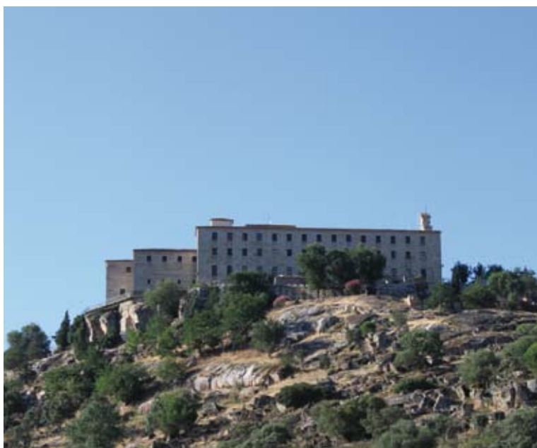
Santuario Nuestra Señora de la Cabeza

gen, congrega a más de 600.000 romeros el último fin de semana de abril en el Cerro del Cabezo desde el año 1304.