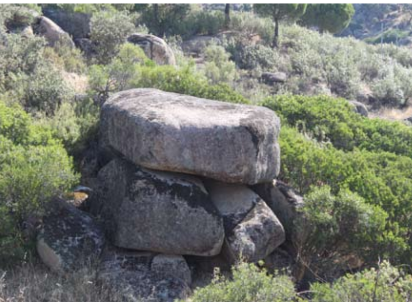
Grandes bloques de granito acompañan al descenso

Volveremos a cruzar otra cancela de paso y en la parte mas baja coincidiremos con la pista que conduce a la Central Eléctrica y el embalse de Encinarejo. En este punto nuestra dirección vira a la derecha por el camino pero existe la opción de visitar el embalse, espacio que en época estival convierte sus orillas en playas de interior.