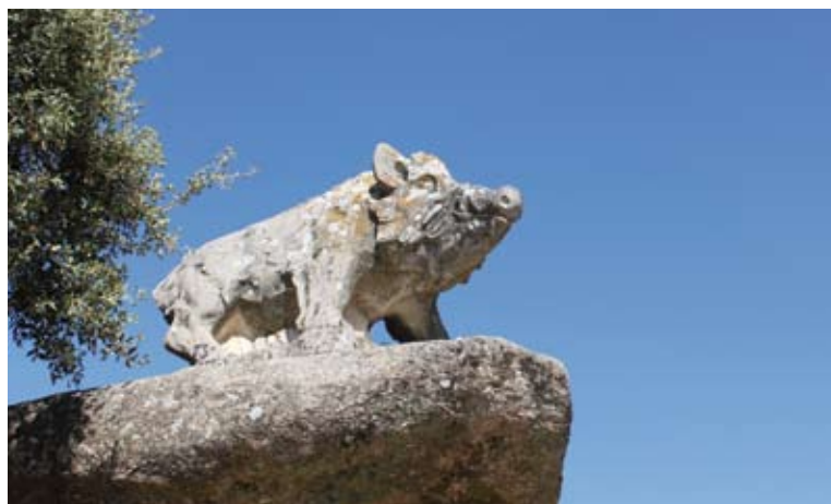
El Jabalí Solitario

Coincidimos en parte con el cortafuegos en las inmediaciones al Área Recreativa del Jabalí donde vuelven a aparecer pinares de repoblación unidos a otras coníferas. La zona de descanso se presenta como un entorno habilitado con bancos y mesas junto a la carretera. Pero el protagonista de este espacio es una estatua tallada en piedra conocida como El Jabalí Solitario. Este monumento, obra del artista andujareño Luis Aldehuela, inmortaliza al protagonista de la obra “Solitario” publicada por el escritor Jaime de Foxá en 1961.