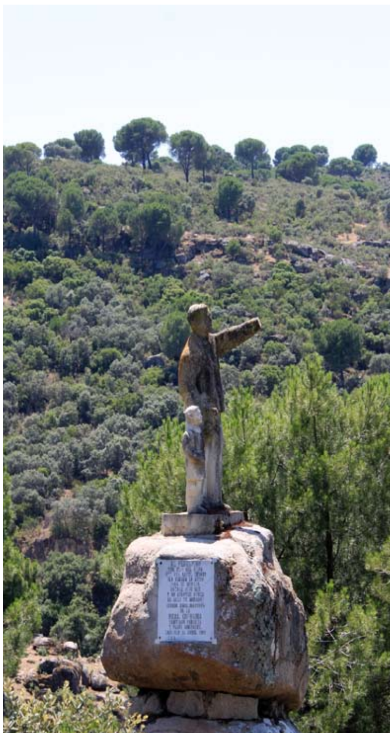
Mirador del Peregrino