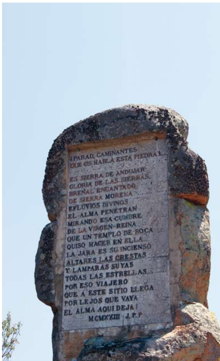
La Piedra que Habla

Apenas queda algo más para el final de la presente etapa, que finalizará en las inmediaciones del núcleo diseminado de Viñas de Peñallana, poco antes del complejo turístico y de restauración de Los Pinos. En este cruce con la carretera de Los Escoriales (JH 5002) finalizamos este itinerario y comienza la siguiente etapa.