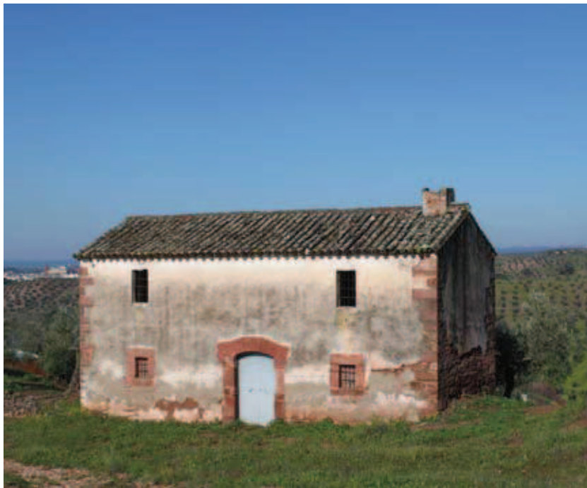
Casa del ventorrillo de Chiriqui

La calzada empedrada por la que caminamos es una verdadera obra de arte. Serpenteante y labrada en la roca, su laborioso pavimento de gui-