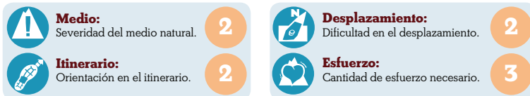
Montoro - Marmolejo