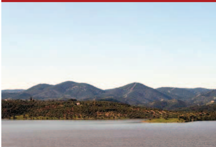
Embalse del Yeguas con el Parque Natural Sierra de Cardeña y Montoro al fondo

seguro sorprenderá: la lámina de agua del embalse del Yeguas con la silueta al fondo de las estribaciones del Parque Natural Sierra de Cardeña y Montoro.