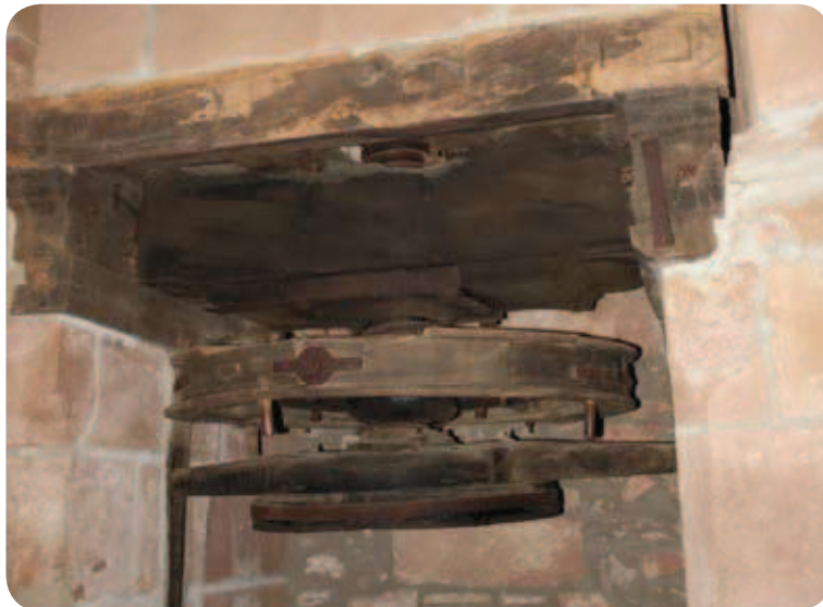
Molino de prensa rehabilitado

Se alcanza de lleno la penillanura de olivar inmersa en el pago de la Nava. Los pagos son distritos rurales en los que se divide la extensa sierra de Montoro. Como tal se extiende a lo largo de una planicie de olivos y mantiene muchos de los molinos tradicionales de aceite que en la actualidad se han habilitado como alojamientos rurales. Prueba de ello son las numerosas indicaciones que conducen a estos establecimientos turísticos.