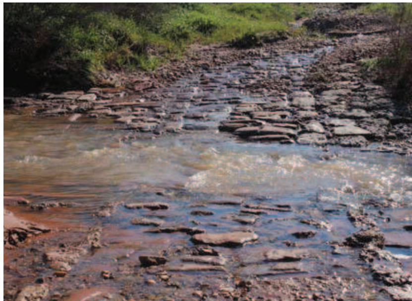
Vado en el arroyo Rosines

Al coronar la loma, a la derecha del camino aparece uno de los molinos de la Palmilla Baja, recientemente remodelado y del que apenas queda testigo un contrafuerte y la torre de contrapeso en arenisca roja entre la que gustan de ubicar sus panales las abejas, como lo delatan los chorreones de miel entre las juntas de la piedra.