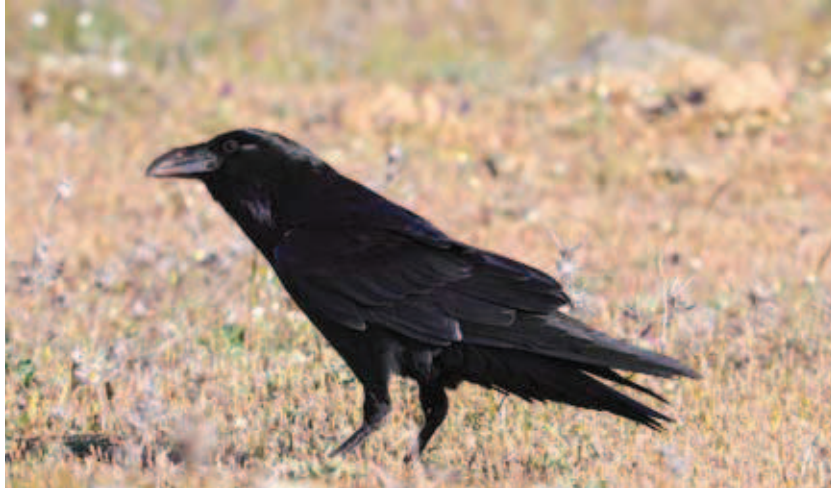
Los córvidos habitan los restos en ruinas de viejas edificaciones

Mientras se asciende se abre el valle de Blanco Hermoso, con el cortijo del mismo nombre sobre la loma de la derecha. En las lomas opuestas, al norte se difuminan las ruinas del pequeño molino de Escalera la Vieja. Estas edificaciones en estado ruinoso son frecuentadas por aves como el cernícalo vulgar o las grajillas que ubican sus nidos en los huecos y fisuras de sus paredes.