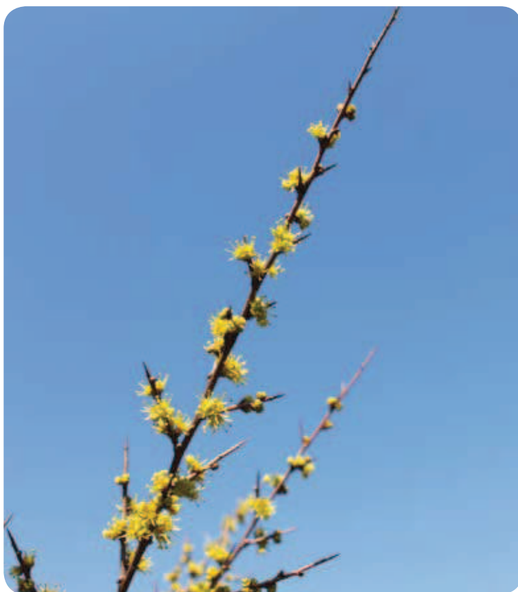
El tamujo: un arbusto espinoso

El arroyo Corcomé, nace en el Parque Natural Sierra de Cardeña y Montoro, concretamente en el Alto de Españares donde se registran las máximas pluviométricas de la provincia de Córdoba. Su caudal, aunque intermitente, riega de vida este valle y palia la aridez durante el verano. La vegetación ribereña aparece representada por tamujos, adelfas, mimbreras y álamos en las zonas donde el cauce es más extenso. En el lecho las características limas rojas delatan el protagonismo erosivo sobre las areniscas del entorno.