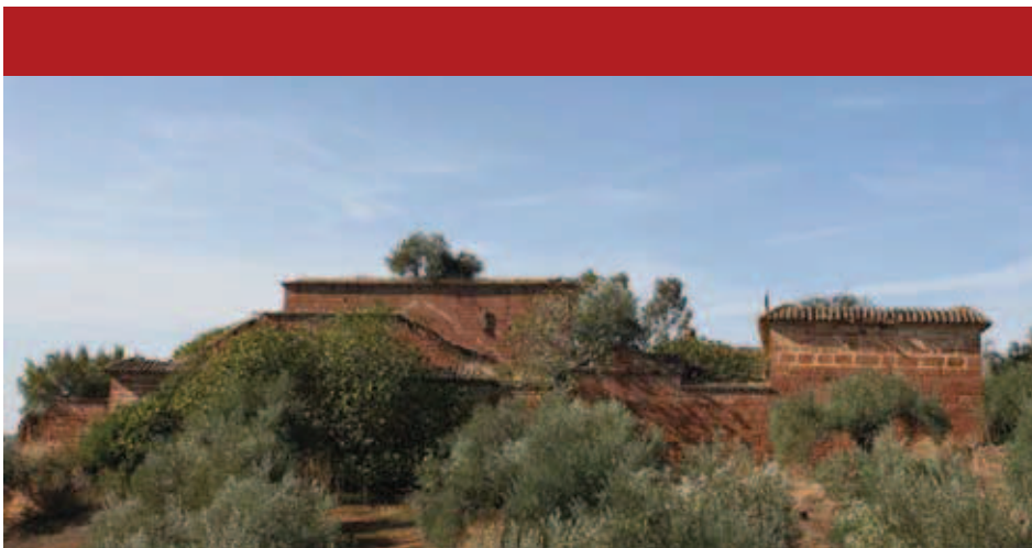
Molino de San Camilo de Lelis