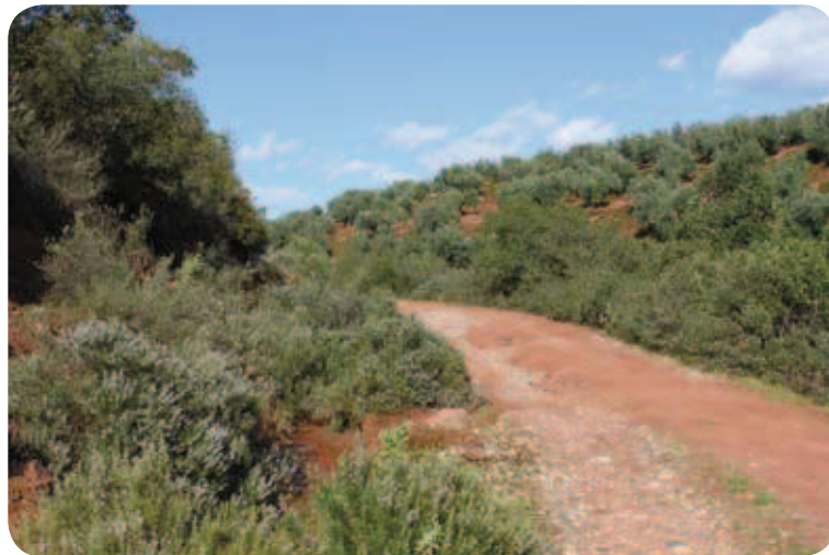
Las plantas aromáticas abundan junto al camino

Esta vaguada se caracteriza por un denso matorral de lentisco y coscoja con abundante cobertura a ambos lados. La ascensión se hace agradable por este oasis verde donde multitud de pajarillos se arremolinan ante nuestra presencia. En algunos álamos del arroyo trepan zarzaparrillas al amparo de la humedad del ambiente. La cobertura del matorral es tal que incluso algunos de estos árboles propios de la ribera se permiten el lujo de crecer en la ladera. Al borde del camino se localizan plantas aromáticas como el romero y el almuradú.