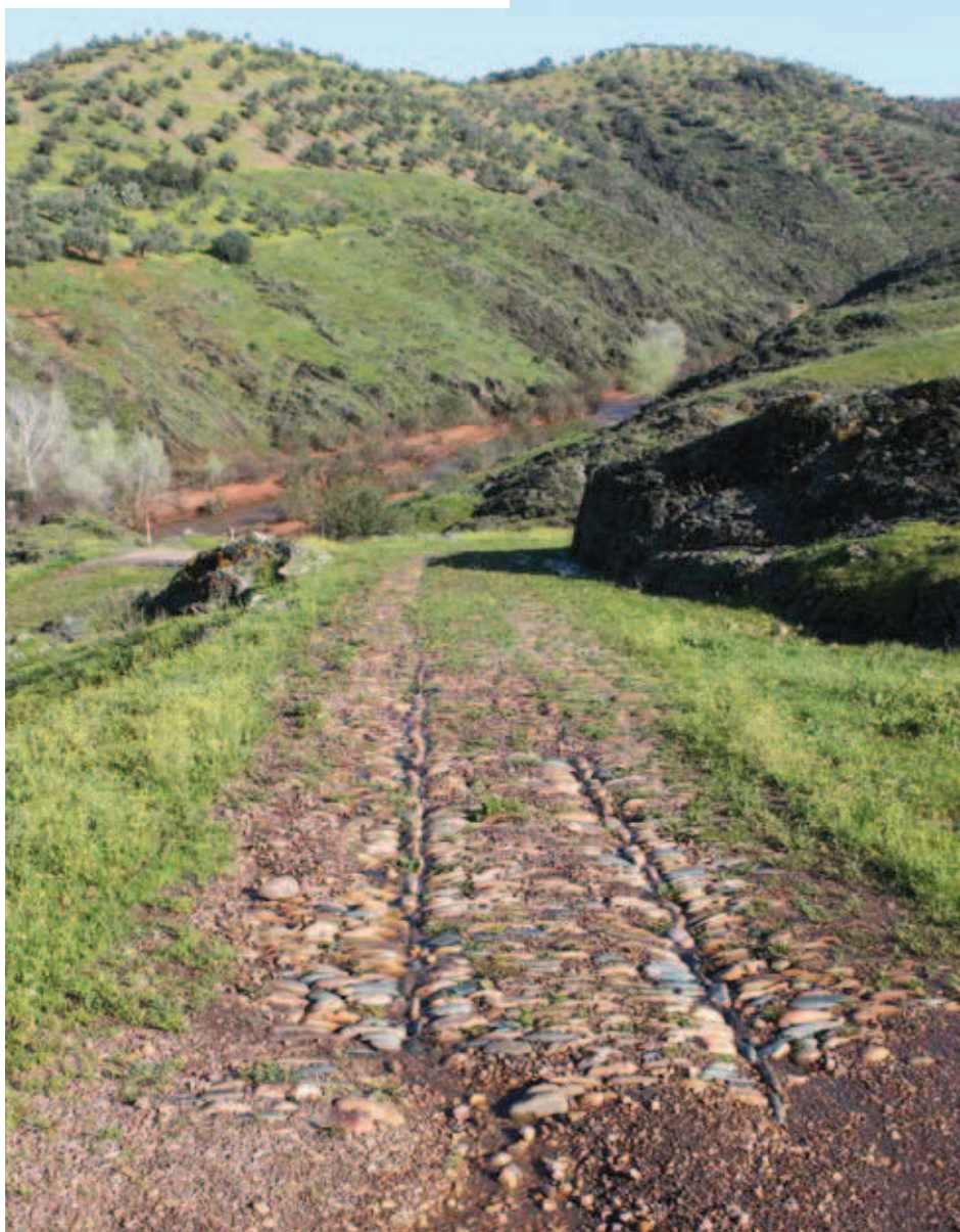
Antiguo camino junto al Martín Gonzalo

Parte la etapa del Puente sobre el Guadalquivir en Montoro, desde el margen opuesto al pueblo, en el barrio conocido como el Retamar se accede a la carretera a Villa del Río A-3102, que en este primer tramo coincide con nuestro trayecto. Ascendemos entre los pinares del campo de tiro y los regajos de arroyos temporales que labran la oscura roca de cuarcita. Atrás irá quedando la bella estampa montoreña.