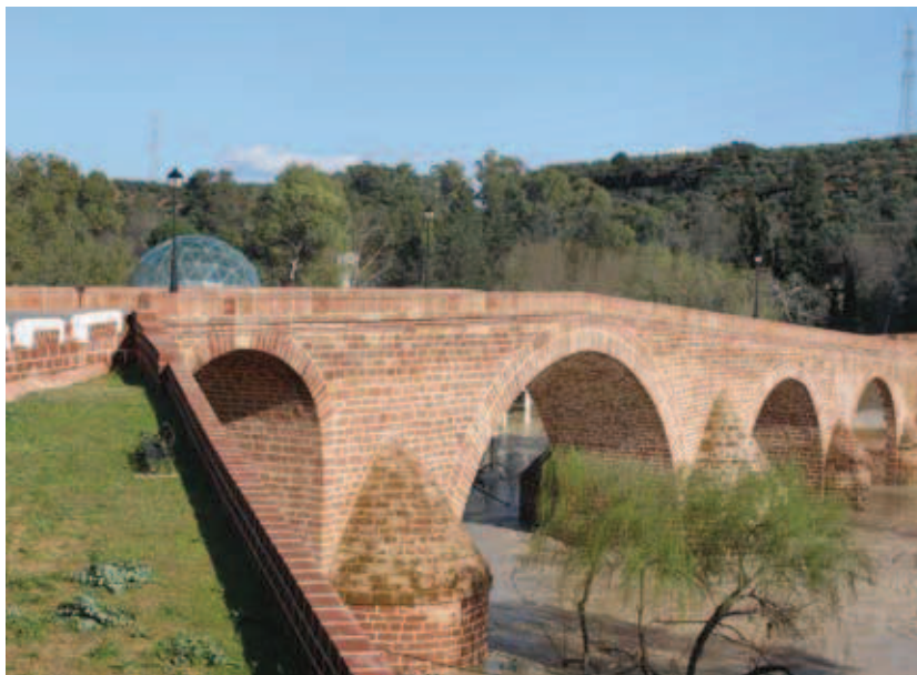
Puente renacentista de Marmolejo

El punto final de la etapa lo marca la llegada al bello puente renacentista situado junto al balneario de Marmolejo.