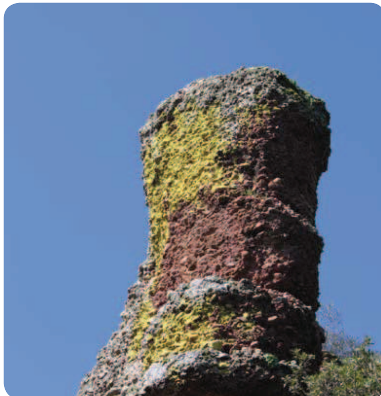
Formas caprichosas en los conglomerados del Bunter

Después de dejar atrás el Molino de la Nava, el camino asfaltado inicia un descenso en el que el matorral empieza a ser más nutrido. Al lado se presentan las lomas de la Roza Alta y el trazado comienza a girar 90° a la derecha dejando a un lado las dependencias en ruinas de la huerta de Jarruña, por la que se unirá paralelo el arroyo del Membrillo.