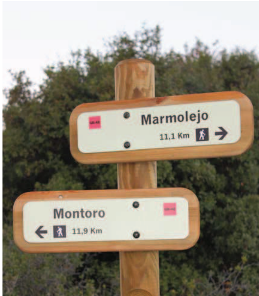
Baliza direccional al final del camino de Mataperros

Pronto culminaremos la ascensión al tiempo que a la izquierda se nos une el camino carretero de Mataperros poco antes de enlazar con la carretera A-3101 en el punto kilométrico 4.